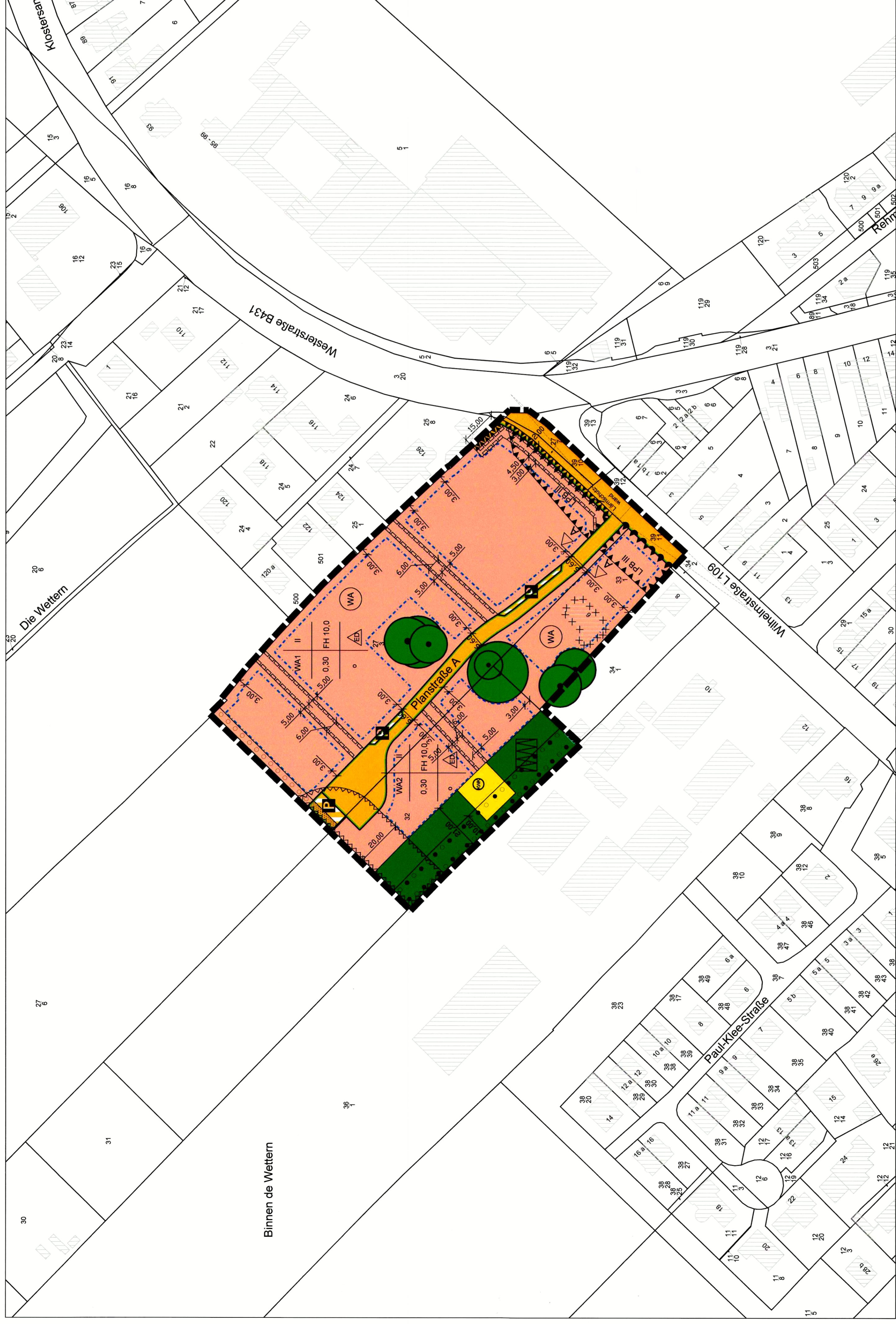
ALKIS-Grundlage Stand 07.10.2016

ES GILT DIE BAUNUTZUNGSVERORDNUNG (BauNVO) IN DER FASSUNG DER BEKANNTMACHUNG VOM 23.01.1990 (BGBl. I S. 132), ZULETZT GEÄNDERT DURCH ARTIKEL 2 DES GESETZES VOM 11.06.2013 (BGBl. I S. 1548)